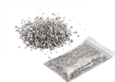
Gryś 500g Nr. Art. 21823