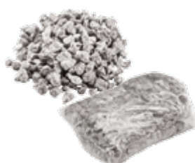
Gryś 1500g Nr. Art. 21824